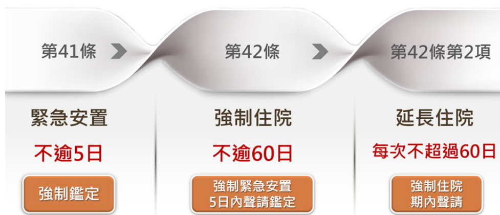
《精神衛生法》之安置流程

強制住院期間，嚴重病人病情改善而無繼續強制住院必要者，指定精神醫療機構應即為其辦理出院，並即通報直轄市、縣（市）主管機關。強制住院期滿或審查會認無繼續強制住院之必要者，亦同 93 。